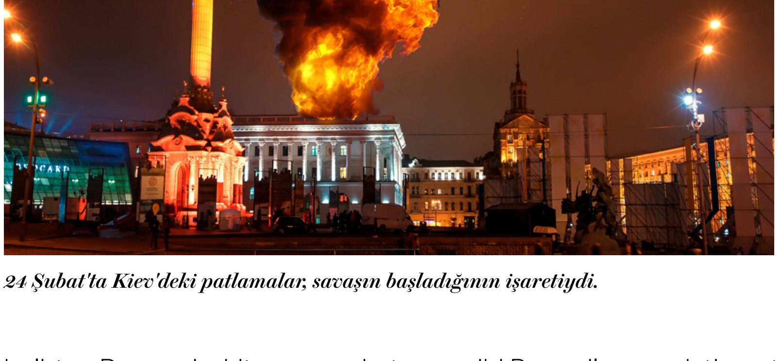
24 Şubat'ta Kiev'deki patlamalar, savaşın başladığını işaretledi.

Rusya'nın fiyatları artacak birçok ana metalin (alüminyum, titanyum, paladyum ve nikel) ana üreticisi olduğunu hatırlatan Demarais, fiyatların en yüksek seviyelerde kalacağını, otomotiv gibi endüstriyel sektörler üzerinde savaşın önemli etkisi olacağını vurguluyor. Şirketlerin Rusya ile ticaret yapmak için finansal kanalları bulmakta zorlanması yüzünden mali yaptırımların tedarik zincirleri ve ticaret üzerindeki etkisi de olabilir. Küresel enflasyonun bu yıl yüzde 6'nın üzerine çıkacağını dile getirildiği raporda daha yüksek fiyatların, merkez bankaları için zor soruları da beraberinde getireceği söyleniyor. Çatışmanın ekonomik etkisinin en çok bu yıl sert resesyonlar yaşayacak Ukrayna ve Rusya'da hissedileceğini